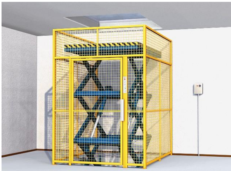
Platforma hidraulica 2 nivele

Este posibil sa realizam si platforme cu dimensiuni speciale la cerere,