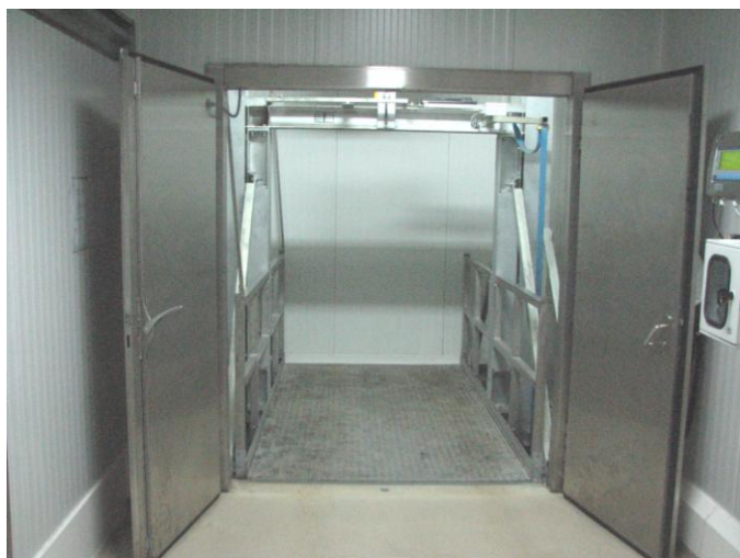
Platforme cu 2 coloane, sarcini uzule pana la 2-5t

Este posibil sa realizam si platforme cu dimensiuni speciale la cerere,