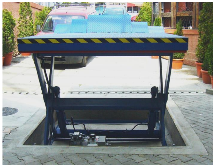
Mese hidraulice aplicatii de trasnbordat marfa Sarcini uzuale 1 – 10 t, speciale pana la 40 t